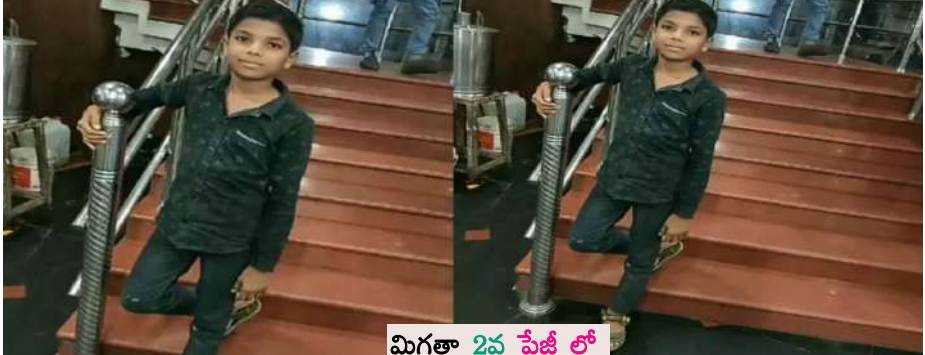
మిగతా 2వ పేజీ లో

బి ఎన్ బి టైమ్స్ పాకిస్తాన్ డిసెంబర్ 12 : భద్రతా పోస్టు దాడి 16 మంది సైనికులు మృతి, 8 మందికి గాయాలు మా గురించిన ఖుంభాల్లో భారీ దాడి జరిగింది. ఈ దాడిలో 16 మంది సైనికులు మరణించగా, 8 మంది గాయపడినట్లు సమాచారం. వెంటనే స్పందించిన భద్రతా బలగాలు ఆ ప్రాంతాన్ని చుట్టుముట్టాయి. దాడి జరిగిన ప్రాంతంలో సోదాలు కొనసాగుతున్నాయి. వాస్తవానికి ఈ దాడి దక్షిణ వజీరిస్థాన్లోని మకిన్లోని లిటా సార్ ప్రాంతంలోని పాకిస్థాన్ భద్రతా పోస్టు జరిగింది. అయితే ఉగ్రదాడి అని అధికారులతో సహా పలువురు అనుమానిస్తున్నారు.