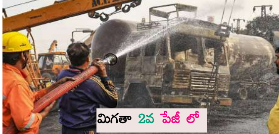
మిగతా 2వ పేజీ లో

బి ఎన్ బి టైమ్స్ టైబూర్ డిసెంబర్ 21 : 11 మంది సజీవ దహనం.. భయంకరమైన రాజసాన్ లోని జైపూర్ నుంచి అజ్మీర్ వెళ్లే హైవేపై శుక్రవారం ఉదయం ఘోర ప్రమాదం జరిగింది. ఉదయం 6 గంటల సమయం కావడంతో రద్దీ తక్కువగా ఉంది. వాతావరణం చల్లగా ఉన్నప్పటికీ, ఒక్కసారిగా కిలోమీటరు మేర మంటలు చెలరేగాయి.