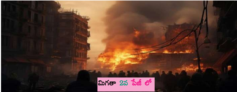
మిగతా 2వ పేజీ లో

బి ఎన్ బి టైమ్స్ పాకిస్తాన్ డిసెంబర్ 12 : భద్రతా పోస్టు దాడి 16 మంది సైనికులు మృతి, 8 మందికి గాయాలు మా గురించిన ఖుంభాల్లో భారీ దాడి జరిగింది. ఈ దాడిలో 16 మంది సైనికులు మరణించగా, 8 మంది గాయపడినట్లు సమాచారం. వెంటనే స్పందించిన భద్రతా బలగాలు ఆ ప్రాంతాన్ని చుట్టుముట్టాయి. దాడి జరిగిన ప్రాంతంలో సోదాలు కొనసాగుతున్నాయి. వాస్తవానికి ఈ దాడి దక్షిణ వజీరిస్థాన్లోని మకిన్లోని లిటా సార్ ప్రాంతంలోని పాకిస్థాన్ భద్రతా పోస్టు జరిగింది. అయితే ఉగ్రదాడి అని అధికారులతో సహా పలువురు అనుమానిస్తున్నారు.