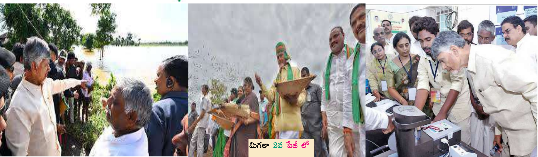
మిగతా 2వ పేజీ లో