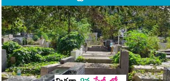
మిగతా 2వ పేజీ లో

బి ఎన్ బి టైమ్స్ కొత్తగూడెం డిసెంబర్ 21 : స్వశాసన వాటిక దగ్గరకు వెళ్లి చూడగా పసి బాబు ఏడుపులు వినిపించాయి. స్వశాసంలో పడి ఉన్న నవజాత మగ శిశువు ఏడుస్తూ కనిపించాడు. రెండు రోజుల క్రితం పుట్టిన నవజాత మగ శిశువును వ్యక్తులు అవదీలి వెళ్ళారు. అమ్మ కోసం, పాల కోసం గుక్కపట్టి ఏడుస్తూ ఉంటే స్థానికులు గుర్తించారు.