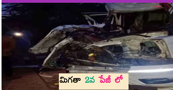
మిగతా 2వ పేజీ లో

బి ఎన్ బి టైమ్స్ మదకవిరి డిసెంబర్ 21 : తెలుగు రాష్ట్రాల్లో రహదారులు నెత్తురోడాలు. సత్వసాయి. సోలోండ జిల్లాలో జరిగిన రోడ్డు ప్రమాదాల్లో ఏడుగురు దుర్భరణం చెందారు. పలువరు తీవ్ర గాయాలతో ఆస్పత్రిలో చికిత్స పొందుతున్నారు. బుళ్లసముద్రం నేషనల్ హైవేపై శనివారం తెలవారుజామిన ఆగి ఉన్న లారీని మిసి వ్యాను ఢీ కొట్టింది.