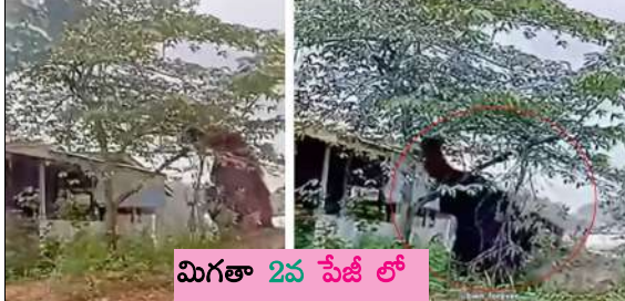
మిగతా 2వ పేజీ లో

బి ఎన్ బి టైమ్స్ తుటి తెమూర్ డిసెంబర్ 21 : చూసి గుండెలో గుబులుపాలిటిక్స్ ఆంధ్ర ప్రదేశ్ ఇంటర్నెట్ నిత్యం అనేక తెగ సందడి చేస్తుంటాయి. వీటిలో ముఖ్యంగా జంతువులు, సరస్వపాలకు సంబంధించిన వీడియోలు అయితే.. ఆసక్తిని చూపిస్తుంటారు. తెలంగాణ సింహం, పులి, చిరుత, మొసలి, కింగ్ కోబ్రా.. ఇలా తమ వేటను జాతీయం బిభత్సంగా వేటాడే క్రూర జంతువులు చాలానే ఉన్నాయి.